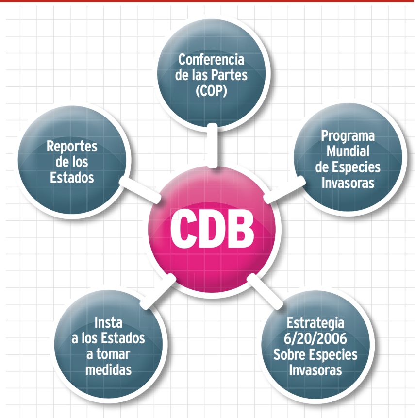
FIGURA 3. MECANISMOS DE LA CONVENCION DE NACIONES UNIDAS SOBRE DIVERSIDAD BIOLÓGICA (CDB).