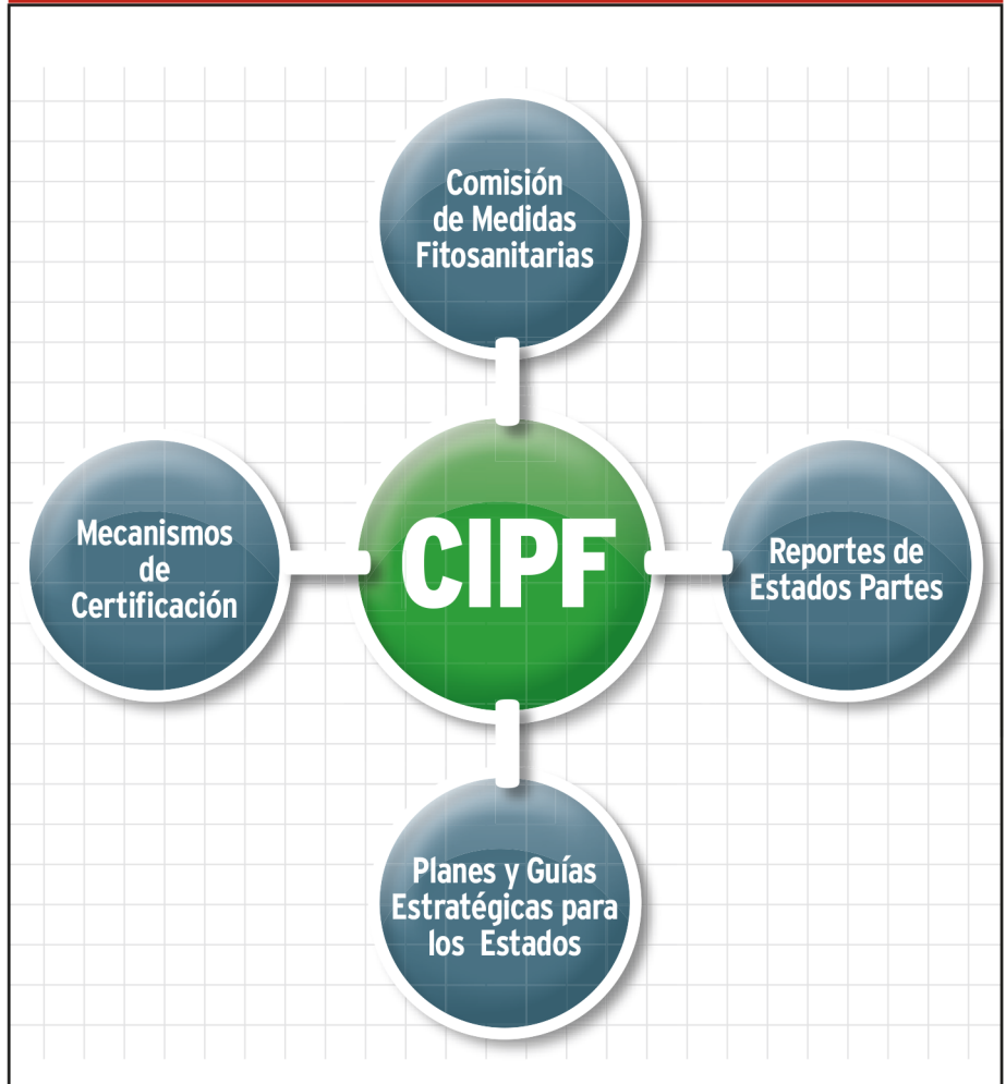
FIGURA 2. MECANISMOS DEL CONVENIO INTERNACIONAL DE PROTECCIÓN FITOSANITARIA (CIPF).

Los Acuerdos internacionales son efectivos, solo si se pueden implementar, en el caso de los dos instrumentos que hemos descrito, es menester ver en la práctica su contribución al control y erradicación de Especies Invasoras. Esta sección analiza la efectividad de estos dos Acuerdos mediante: a) las conclusiones del Grupo de Expertos del Convenio Internacional