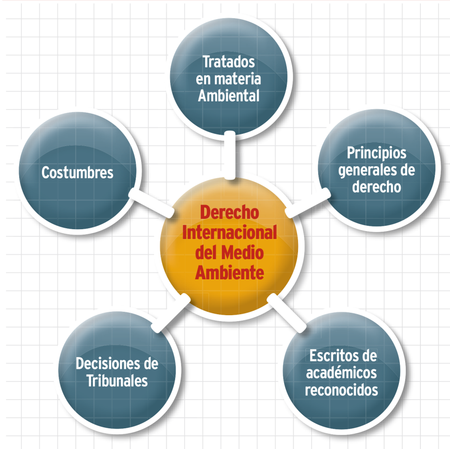
FIGURA 1. FUENTES DEL DERECHO INTERNACIONAL DEL MEDIO AMBIENTE.

Esta especie carnívora, dotada de espinas venenosas, representa un peligro para la diversidad biológica y salud humana en la región del Golfo de México (Conabio, 2010). Ante la problemática latente de las Especies Invasoras en esta era de cambio climático y de grandes desastres naturales (como el huracán Alex presentado en el año 2010, que permiten que las especies se desplacen más rápido debido a inundaciones) es menester preguntarse si los problemas nacionales de falta de coordinación institucional, recursos financieros y capacidad científica para monitoreo pueden ser mitigados por el Derecho Internacional.