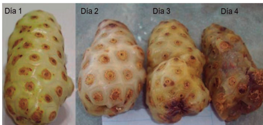
Figure 3. Effects of temperature 28 \pm 2 °C in the postharvest life of the noni fruit.

Efectos de la temperatura ambiente 28 \pm 2 °C en la vida poscosecha de la fruta de noni.