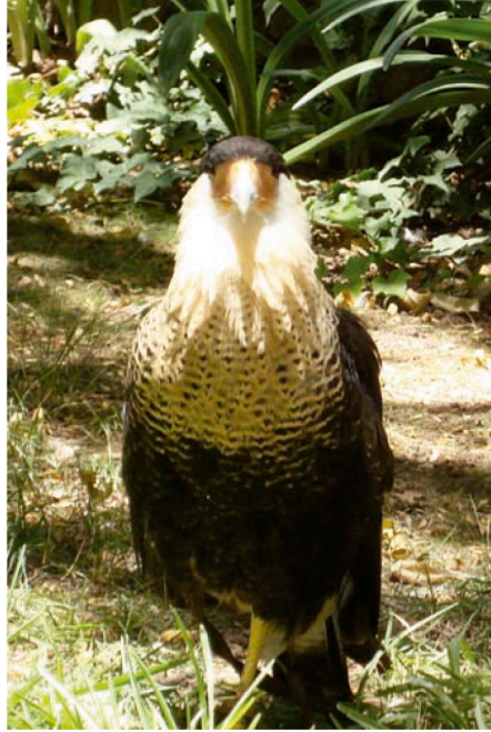
Crested caracara ( Caracara cheriway ), habita en la biósfera El Cielo, del estado de Tamaulipas.

Se ubica al norte del estado en la ciudad de Reynosa, tiene en la actualidad escasa demanda de visitantes. Las problemáticas de contaminación y establecimiento de asentamientos humanos irregulares, ha disminuido en gran medida el atractivo que pudo haber tenido desde el punto de vista turístico. Afortunadamente, el proyecto vigente de restauración de este cuerpo lacustre representa la mejor forma de recuperar su potencial de aprovechamiento turístico. La Escondida se proyecta como un lugar adecuado para el esparcimiento y para el ecoturismo, debido a la riqueza de aves acuáticas que habitan de manera