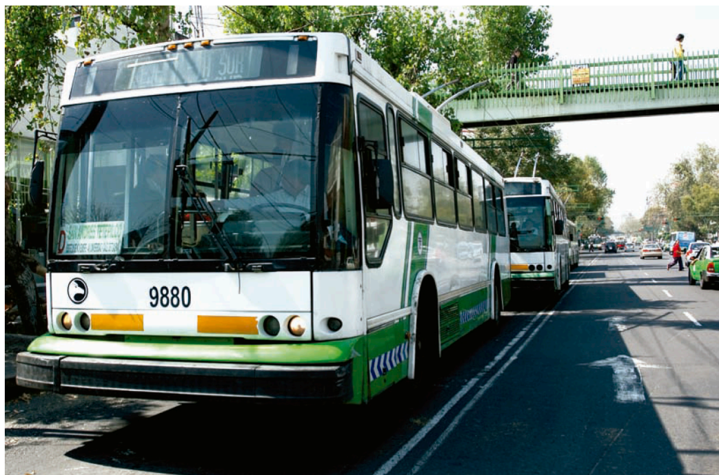
Utilizar el servicio público de transporte en lugar del particular, reduciría la emisión de CO 2 .

Las reducciones del calentamiento previsto por el modelo para 2050 (2,5°C) eran respectivamente 0,11-0,21°C (aproximadamente 6%), 0,06-0,11°C (3%) y alrededor de 0,35°C (14%). En todos los casos los resultados son muy modestos. Los llamados escépticos se atuvieron al segundo caso (3% de 2,5°C, es decir, 0,7°C) y lo esgrimieron sistemáticamente como prueba de la inutilidad del protocolo de Kyoto. Fue usado por ejemplo, en el Congreso de Estados Unidos, aún bajo la administración Clinton, para parar la adhesión a Kyoto, (7) Wigley es citado por los opuestos a cualquier regulación para declarar que el protocolo de Kyoto es innecesario, por inútil, en contra de la