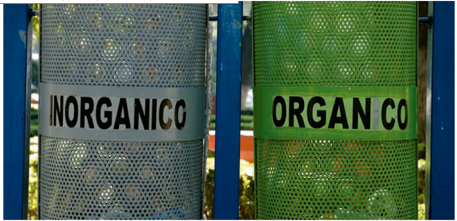
La separación de los residuos facilitará el reciclaje de la basura.

Los GEI son suficientemente transparentes a la radiación solar visible y calienta su superficie, pero relativamente opacos para la radiación infrarroja